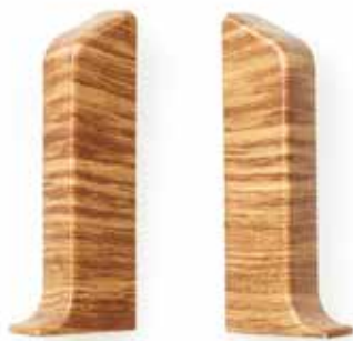
KONCOVKA LEVÁ - PRAVÁ

Inner corner Inneres Eckstück Внутренний угол