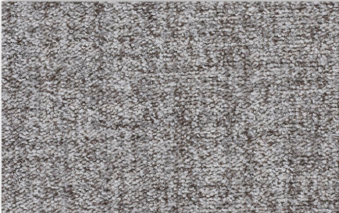
94 4m + 5m