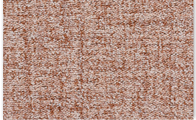
80 4m + 5m