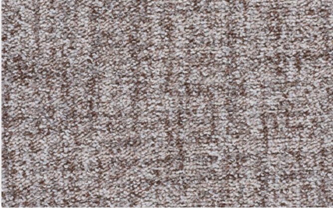
39 4m + 5m