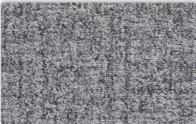
97 4m + 5m